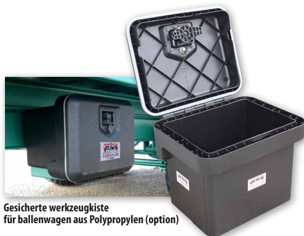
Gesicherte werkzeugkiste für ballenwagen aus Polypropylen (option)