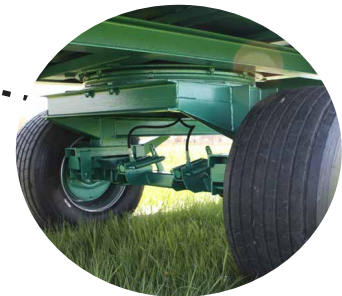
Drehschemel mit Pendelachse