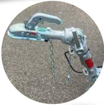
> Ausleger Deichsel