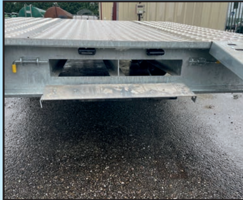
4 Schliessen der Klappe