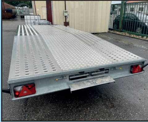
1 Öffnung der Klappe