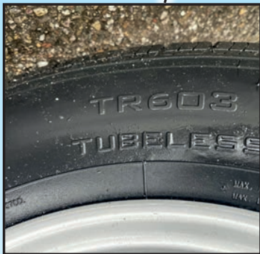
Räder 185R14C 3 Achsen