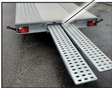
Siehe Seite 3 Anlegen von Rampen

Fotos nicht vertraglich bindend. Die Eigenschaften, Maße und Gewichte, die auf diesem Blatt aufgeführt sind, haben nur Richtwert.