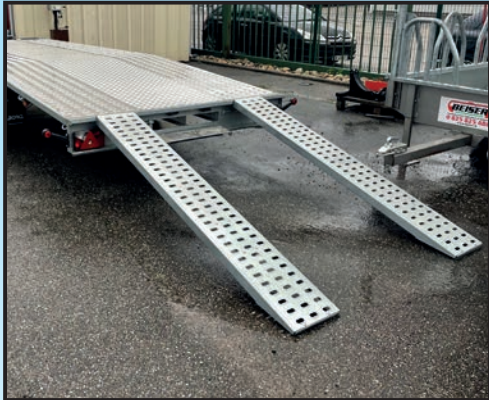
3 Anbringen von Rampen