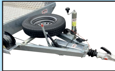
Ersatzräder auf einer Halterung befestigt