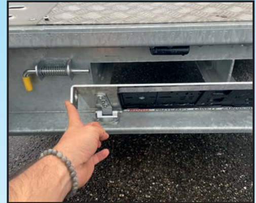
5 Schliessen der Klappe