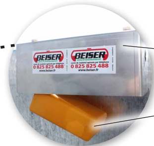
Schwimmer- Schutzgehäuse aus Edelstahl