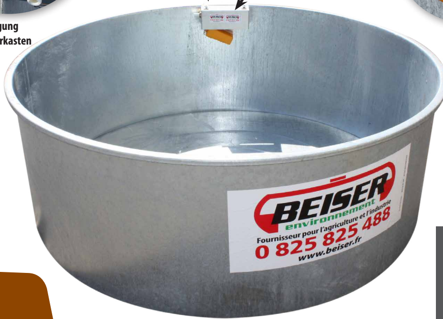
Schwimmer aus PVC