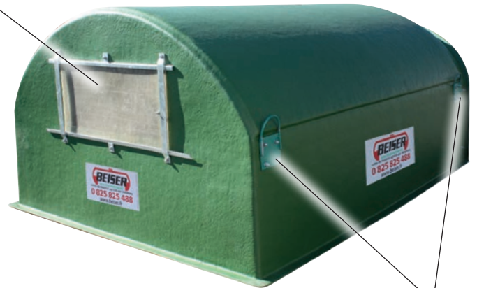
Tragegriffe für den Transport