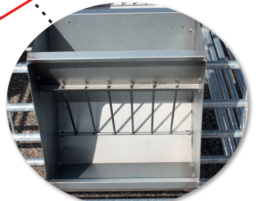
Serienmäßige Einhängeraufen (6 Stück)