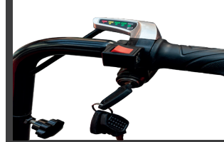
Vorwärts- / Rückwärtswähler am Griff mit Ladeanzeige

*Diese produkt ist keine hubarbeitsbühne