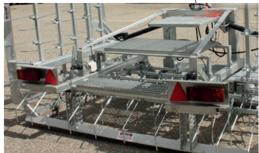
- Serienmäßige Beleuchtung bei dem Modell 2 - Installation einer Säschar möglich (optional, fragen Sie uns)