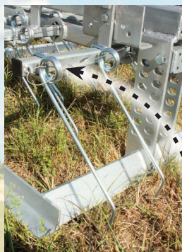
Flexible gebogene Zinken ø 8 mm