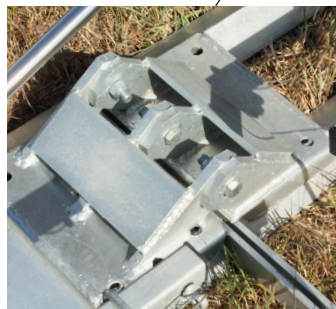
Verstärkte Gelenkverbindung für das Einklappen