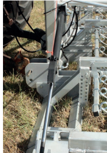
Zweifach wirkender Zylinder mit Sicherung