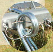
Stahldraht gegen Zinkenverlust