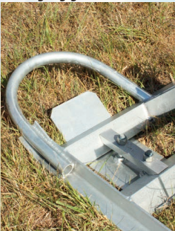
Kufen für verbesserte Bodengängigkeit