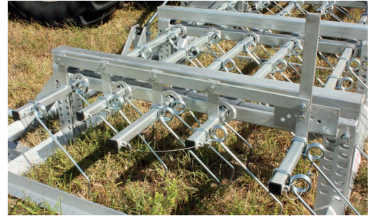
- Einstellung der Zinkentiefe - Einstellung des Neigungswinkels der Zinken, einmalig bei dem Modell 2