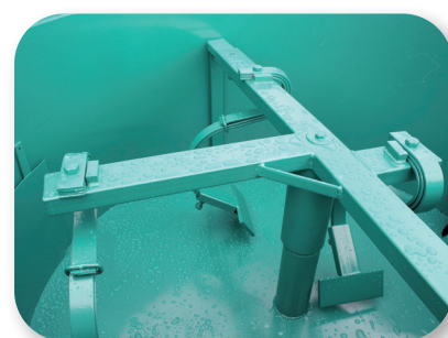
Abstreifer auf Federsystem