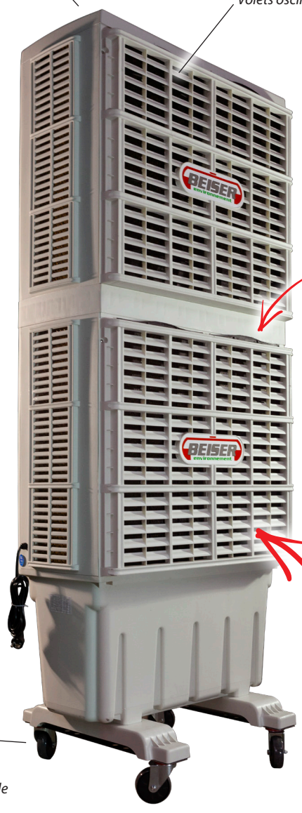
Boîtier électronique de mise en fonction