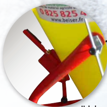
Hebel zum Öffnen/ Schliessen der Luke