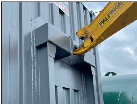
Einsetzen des Ampliroll-Handlingsarms am Schwanenhals des Containers zum Beladen