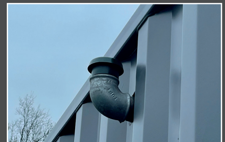
Entlüftung des Dieseltanks ausserhalb des Containers

BEISER Environnement • Domaine de la Reidt 67330 BOUXWILLER, Frankreich