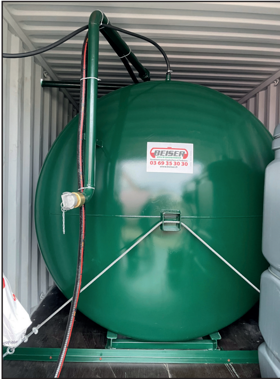
10.000L doppelwändiger Dieseltank, am Container angedockt

➤ Beispiel eines umgebauten Containers zur Lagerung und Verteilung von Treibstoff und AdBlue auf einer Langzeitbaustelle.