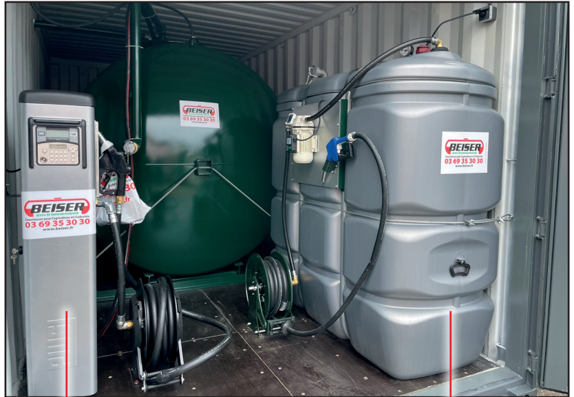
Verteiler mit integrierter Verwaltung