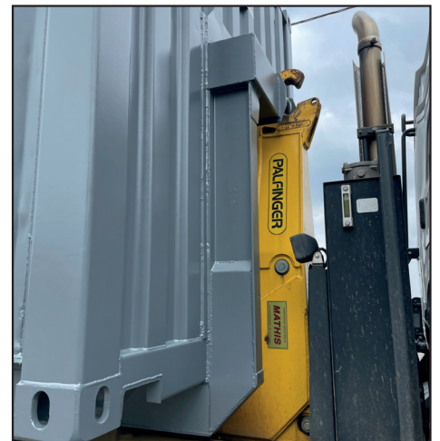
Ampliroll-Einhaken-Arm in Transportstellung eingeklappt