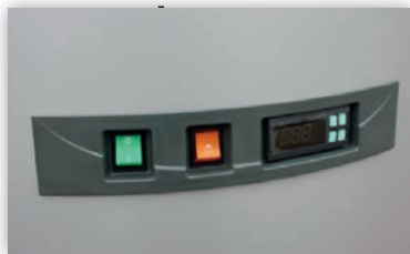
Schalttafel des Kühlaggregats und Lichtschalter (220 V)