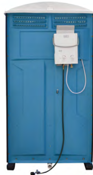
> Ausgestattet mit einem Gas-Wasserehitzer