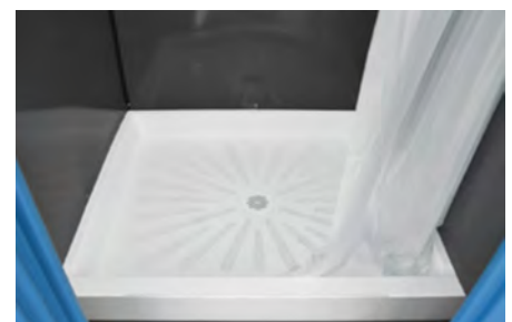
> Große weiße Duschwanne mit Antirutsch Streifen